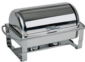
CHAFFING ROLL TOP