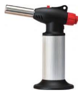
TORCHE A CAMELISER