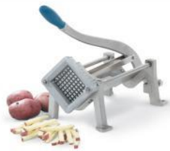
COUPE POMME DE TERRE