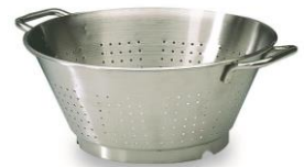
PASSOIRE CONIQUE INOX