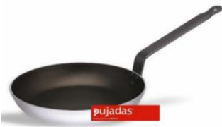
POÊLE ANTI-ADHESIVE HERCULE