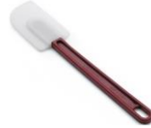
SPATULE HAUTE TEMPERATURE