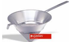
CHINOIS A GAZE